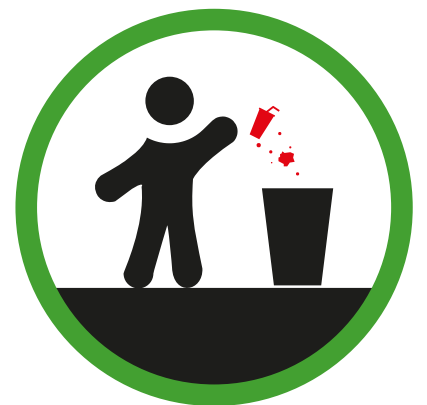
GOOI ZELF JE AFVAL WEG