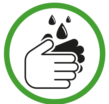
DESINFECTEER JE HANDEN BIJ BINNENKOMST