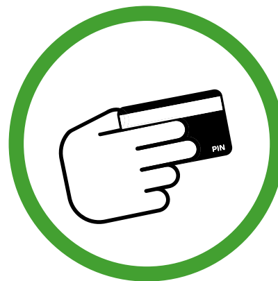
BETAAL MET PIN